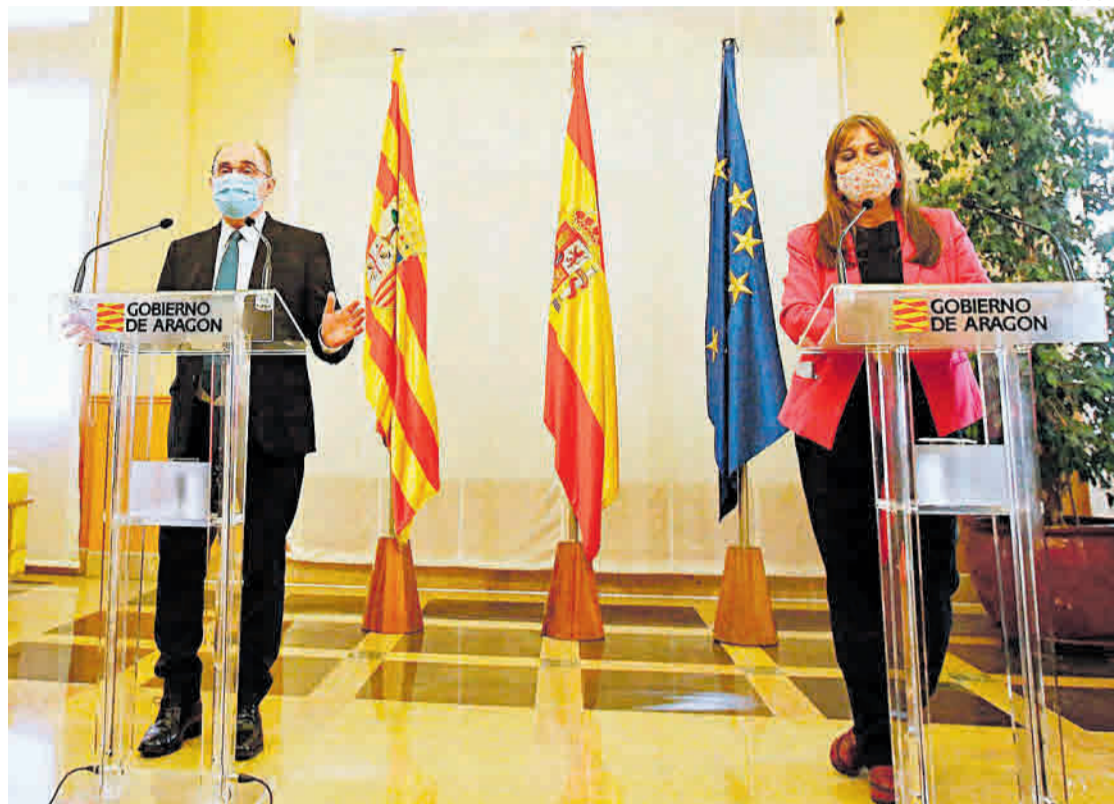
Anuncio. El presidente de Aragón y la consejera de Sanidad anuncian que Aragón pasa a nivel 3 de alerta.